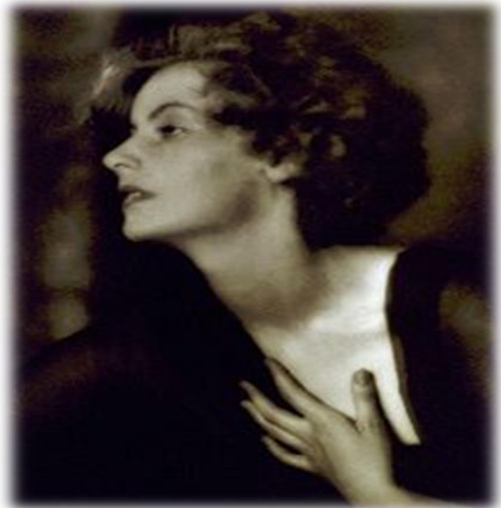
Greta Garbo jedna z pierwszych gwiazd kina niemego

Kręcenie filmów stało się możliwe, gdy Thomas Alva Edison wynalazł kinetoskop. Wynalazek ten po raz pierwszy wystawiono publicznie w Nowym Yorku w 1894 roku. Rok później bracia August i Louis Lumière wynaleźli kinematograf, który wyświetlał obrazy na ekranie. 17 metrów taśmy starczyło na nakręcenie ok. 50-sekundowego filmu. Pierwszy pokaz filmowy odbył się 28 grudnia 1895 roku – wystawiane filmy to dwuminutowy obraz pt. Wyjście robotników z fabryki oraz Wjazd pociągu na stację w La Ciotat. Wynalazek braci Lumière szybko znalazł wielu zwolenników.